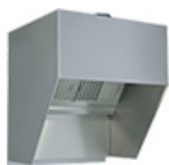
هود سرخ کن